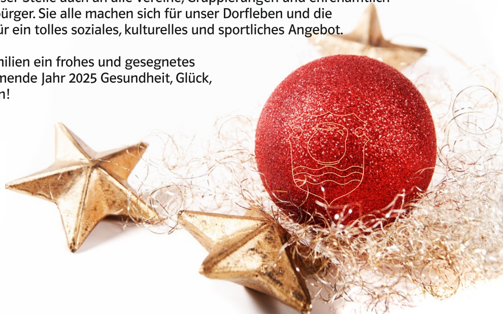
Thorsten Schwab 1. Bürgermeister